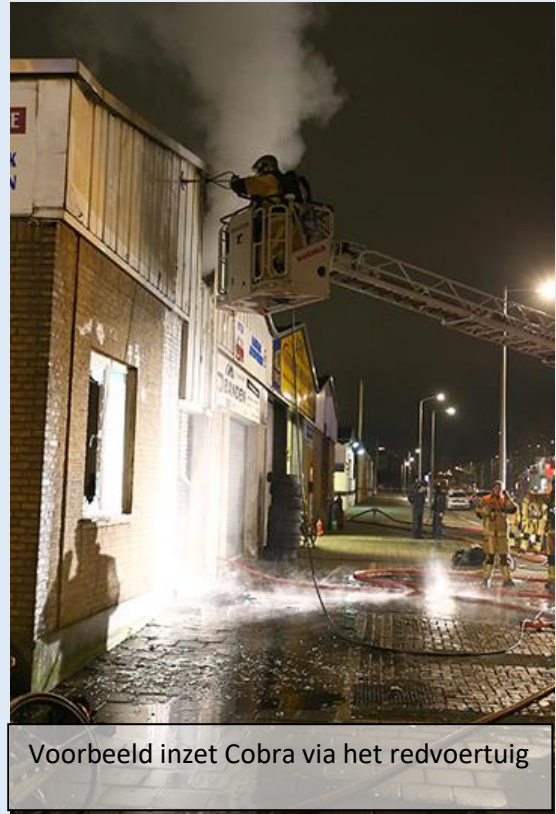
Voorbeeld inzet Cobra via het redvoertuig

Bij aankomst kwam er rook aan de zij-, onder- en bovenkant van de roldeur vandaan. Er werd geknetter gehoord achter de roldeur wat wellicht op elektra kon duiden. De stroom werd afgeschakeld. De brand was ventilatie gecontroleerd. Door eerst een Cobra in te zetten en daarna af te blussen met een LD is er gecontroleerd ingezet.